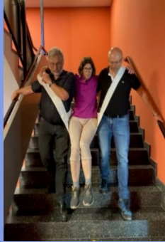
Rettungssitze im grünen Notfallkasten in jedem Obergeschoss

In this case, the emergency services must be informed immediately of the location (112)!